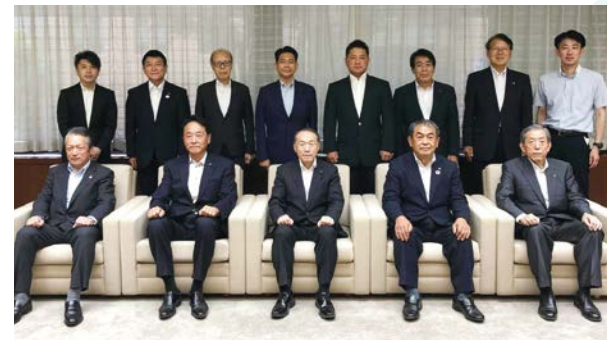
令和4年度「東埼玉道路建設促進期成同盟会」(行政関係)並びに「建設促進協議会」(商工会関係)による知事要望と議長並びに東埼玉道路及び周辺整備建設促進協議会に対する要望活動

「資産の運用は難しい」と言われながらも、必要性は認識されているわけですから、金融の知識を幼少期から得ることによって、人生の将来設計の一助に繋がっていくと考えられます。